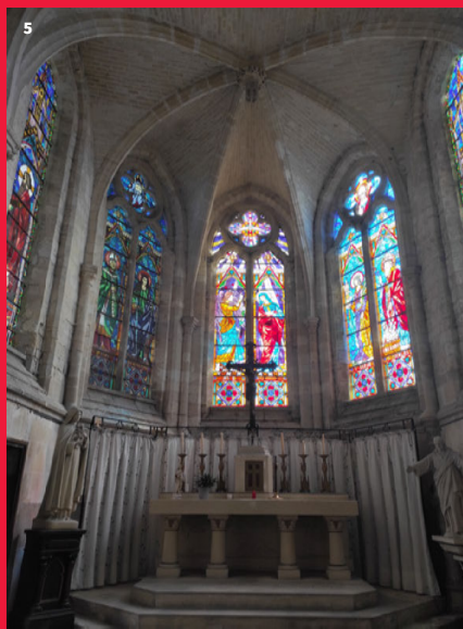
6 • Église, Puzeaux